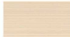
G : NH4349A / SS NH4349A9 J : NH4349K / SS NH4349K9 QFパール チタン オレンジ