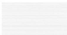
G : NH4347A / SS NH4347A9 J : NH4347K / SS NH4347K9 QFマックス チタン ホワイト