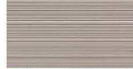
G : NH4344A / SS NH4344A9 J : NH4344K / SS NH4344K9 QFシルク チタン グレー