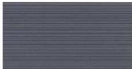
G : NH4346A / SS NH4346A9 J : NH4346K / SS NH4346K9 QFアトランティック チタン ブルー