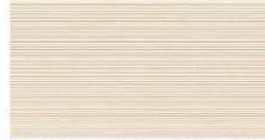
G : NH4343A / SS NH4343A9 J : NH4343K / SS NH4343K9 QFアッシュ チタン ベージュ