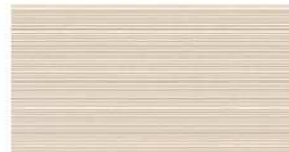
G : NH4348A / SS NH4348A9 J : NH4348K / SS NH4348K9 QFマット チタン ベージュ