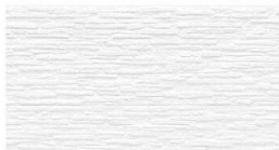
CW2211GC MWマックスホワイト