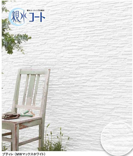
ブティレ (MWマックスホワイト)

素朴なテクスチャーにセラディールならではの風合いが加わり、質感のある外観を演出。