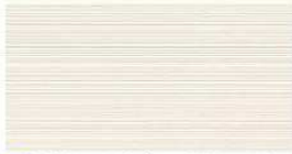
G : NH4341A / SS NH4341A9 J : NH4341K / SS NH4341K9 QFシルク チタン ホワイト