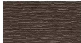
CW2214GC MWチャコールブラウン