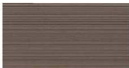
G : NH43410A / SS NH43410A9 J : NH43410K / SS NH43410K9 QFスマート チタン ブラウン